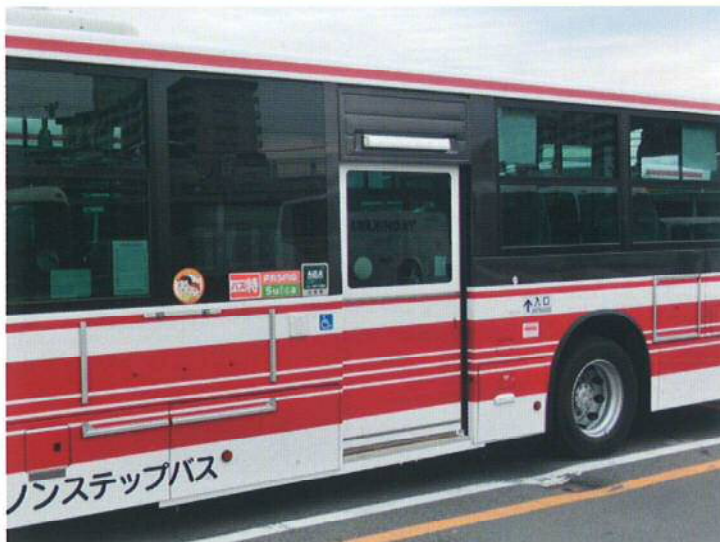
車体にぴったりフィットし、一体感を演出します。