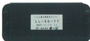
車外照射灯タイマー