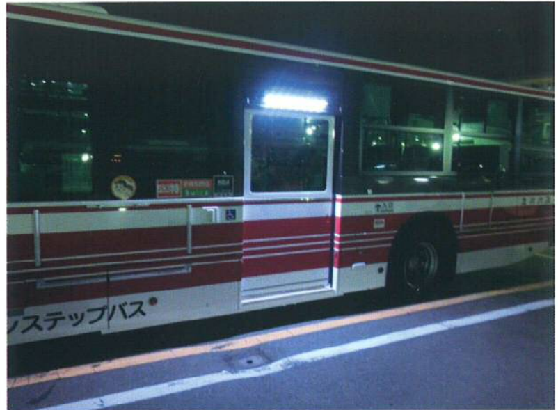
夜間でもここまで明るくなります

インバータが不要になります。また、蛍光管の交換作業がなくなりますのでランニングコストを大幅に削減できます。