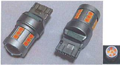
VT-TR20 OR LEDウィンカーバルブ T20型 (シングル) オレンジ (2個1SET)

業界初 全品DC24V~48Vトラックの 電圧トラブルに対応します。驚異の明るさです。