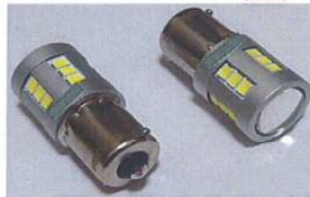
VT-TRS25 W (2個1SET) LEDウィンカーバルブ S25型 (ピン角180) ホワイト

サイズ:最大外径19mm (アルミ外径部分) 全長 約43mm ルーメン値: 800LM 電源電圧: (DC24~48V) LED球種類: Epistar2835 LED球使用数: 24pcs (正面6発/側面18発)