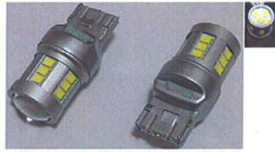
VT-TR20 W LEDウィンカーバルブ T20型 (シングル) ホワイト (2個1SET)

サイズ:最大外径19mm (アルミ外径部分) 全長 約43mm ルーメン値: 800LM 電源電圧: (DC24~48V) LED球種類: Epistar2835 LED球使用数: 24pcs (正面6発/側面18発)