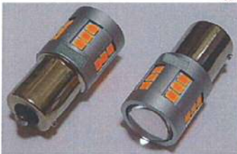
VT-TRS25 OR (2個1SET) LEDウィンカーバルブ S25型 (ピン角150) オレンジ

サイズ:最大外径19mm (アルミ外径部分) 全長 約43mm ルーメン値: 800LM 電源電圧: (DC24~48V) LED球種類: Epistar2835 LED球使用数: 24pcs (正面6発/側面18発)