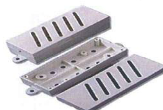
抵抗器 熱遮断ケース VT-HRC200 (2個1SET)