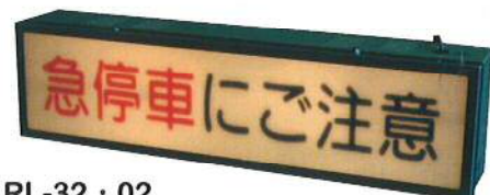
RL-32 · 02