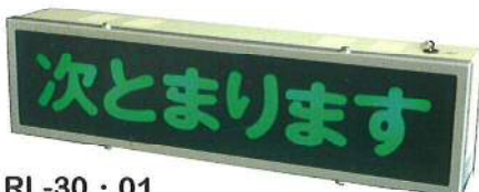
RL-30 · 01