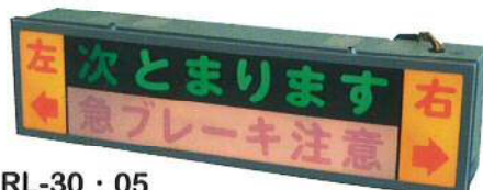
RL-30 · 05